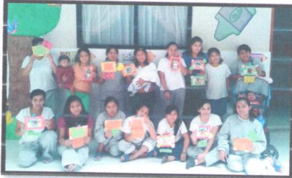
Albergue SVET, Departamento de Guatemala. Aprendiendo a trabajar en equipo.