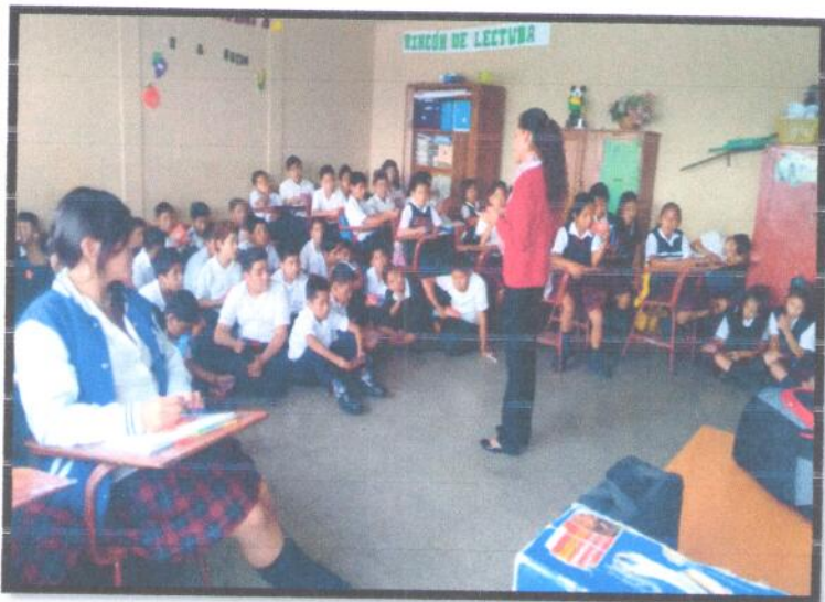
Departamento de Guatemala. Primaria Vespertina. EOUM No.71 Franklin Delano Roosevelt.