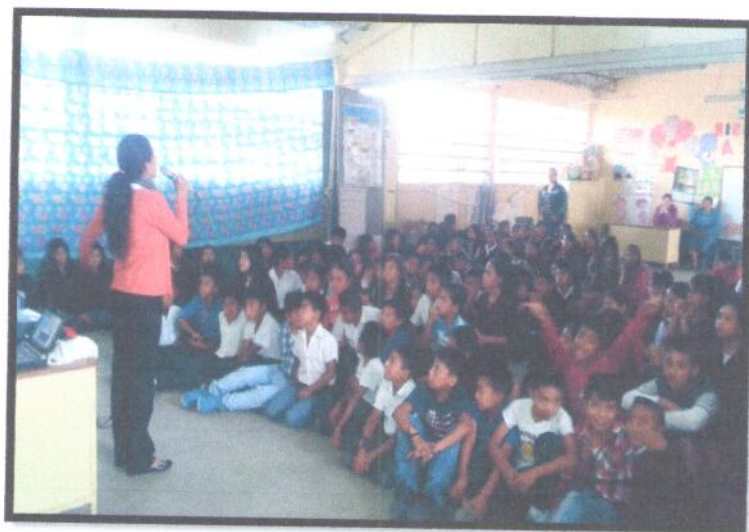
Departamento de Chimaltenango. Primaria Vespertina. EOUM Colonia Santa Teresita zona 2.