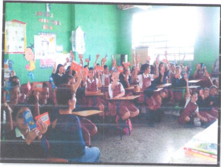
Departamento de Guatemala. Primaria Matutina EOUN No.55 Sara Cerna Zepeda.