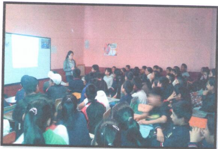
Departamento de Chimaltenango. Primaria Matutina. EORM Aldea Buena Vista.