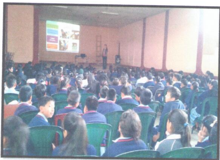
Departamento de Chimaltenango. Primaria Matutina. EOUM José Joaquín Pardo Gallardo.