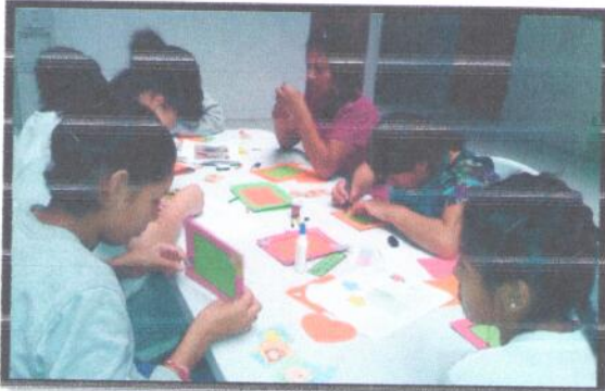
Albergue SVET, Departamento de Guatemala. Realización de Marco Fotográfico.